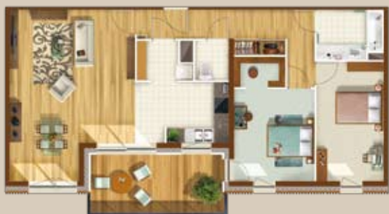
■ Exemple de 3 pièces (B23)