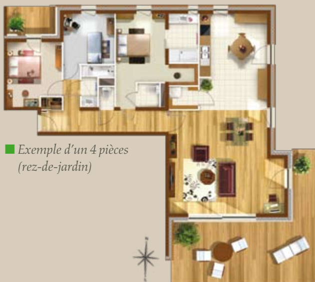
■ Exemple d'un 4 pièces (rez-de-jardin)