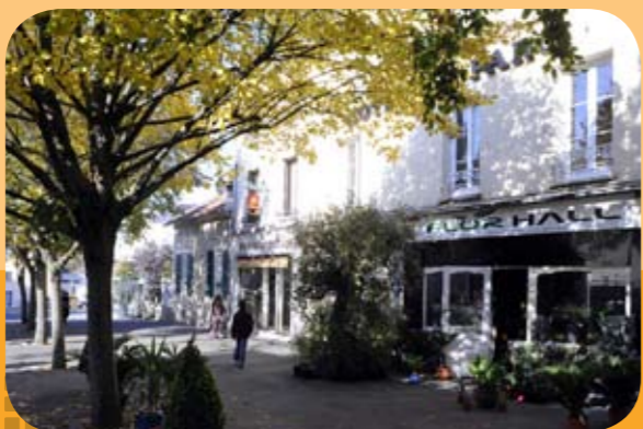
Bourg de Montévrain

À 30 minutes de Paris par l'autoroute A4, le quartier Montévrain - Val d'Europe s'inscrit dans la dynamique d'un pôle économique majeur. Première destination touristique d'Europe avec le parc d'attraction Disneyland®, Val d'Europe conjugue tous les avantages d'un territoire au service de ses habitants. Plébiscité par tous et élu par de prestigieuses entreprises, il multiplie les infrastructures innovantes, parmi lesquelles un pôle universitaire, les commerces de la Vallée Village, le centre commercial international, 2 gares RER A ou une gare TGV.