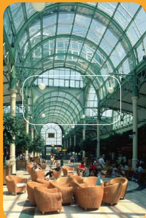
Intérieur du centre commercial du Val d'Europe à Serris