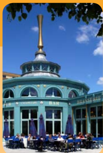
Brasserie l'Agape Café située sur la Place d'Ariane à Serris

Charmant village ancien, Montévrain cultive, avec art, l'authenticité de son cadre de vie. La ville bénéficie d'un environnement convivial, propice à l'épanouissement de tous. Renommée pour son club hippique dans tout le département, elle profite de la richesse naturelle de ses nombreux parcs, bois et espaces verts.