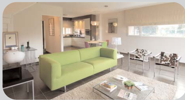
Exemple de type 3 - Apt 109 - Etage 1