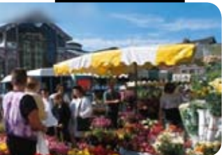
Marché de Wazemmes

Haute Performance Énergétique Résidences closes et sécurisées Espace vert privatif