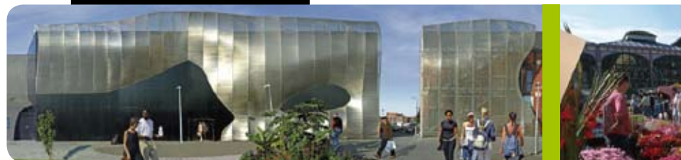
La Maison Folie de Wazemmes - Centre culturel